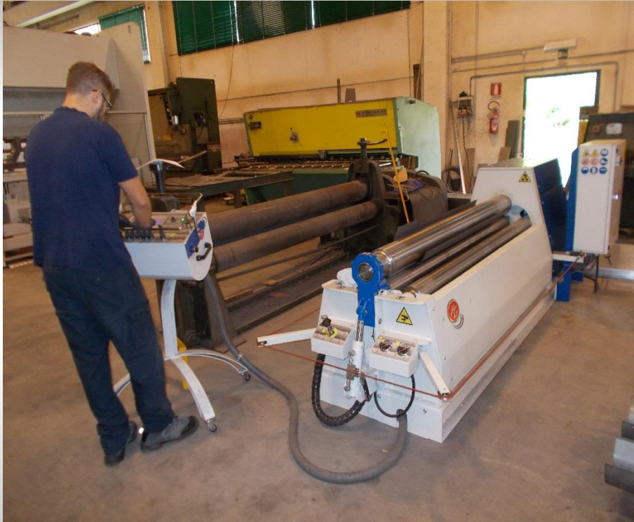
Calandra Idraulica MG Tipo M2006P 4 Rulli a controllo Campo di lavoro 2000 mm