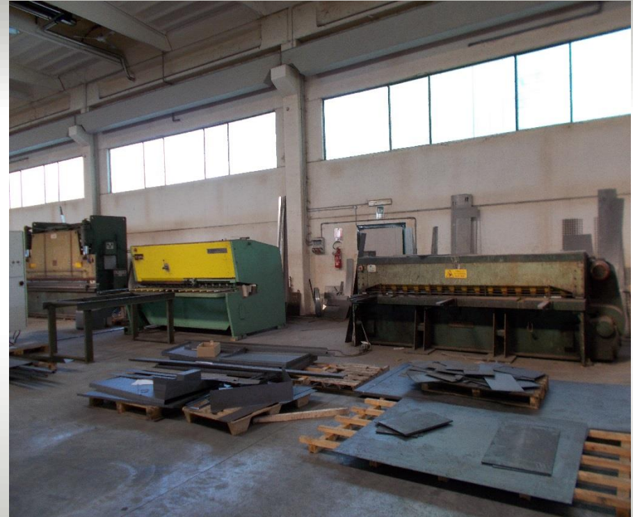
Cesoie lamiera SCHIAVI Campo di lavoro 3000 mm