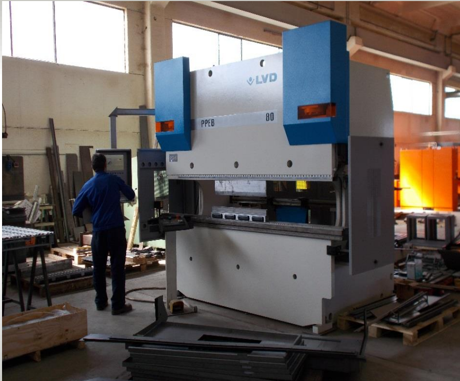
Piegatrice LVD Tipo PPEB

Potenza 80 Tonn. Campo di lavoro 2500 mm